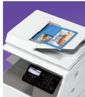
Scansione di rete full colour